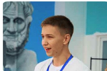
Проект-конкурс ТОЛКОВЫЙ СПИКЕР ПФО

Всероссийский конкурс по практическому освоению социальных навыков, в котором принимают участие команды обучающихся профессиональных образовательных организаций. В рамках Конкурса участники, выполняя практические задания, демонстрируют степень развития своих гибких навыков в 5 компетенциях, которую на протяжении всего Конкурса оценивает экспертное жюри