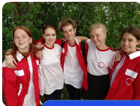
Слет Всероссийского проекта “Хранители истории” (Волгоград) - команда МАОУ "СОШ №80" г.Северск