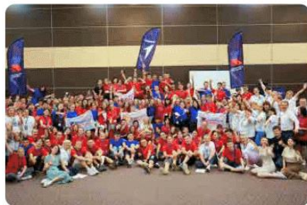
Всероссийский конкурс КОМАНДА ПЕРВЫХ

Онлайн-марафон, направленный на повышение престижа среднего профессионального образования через практическое применение профессиональных и универсальных навыков обучающихся выпускных курсов профессиональных образовательных организаций при реализации социально значимых мероприятий