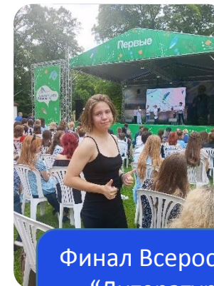
Финал Всероссийского проекта “Литературный марафон” (Орел)