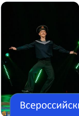
Всероссийский фестиваль “Российская школьная весна” (Ставрополь) Гран-при. Танцевальное направление.