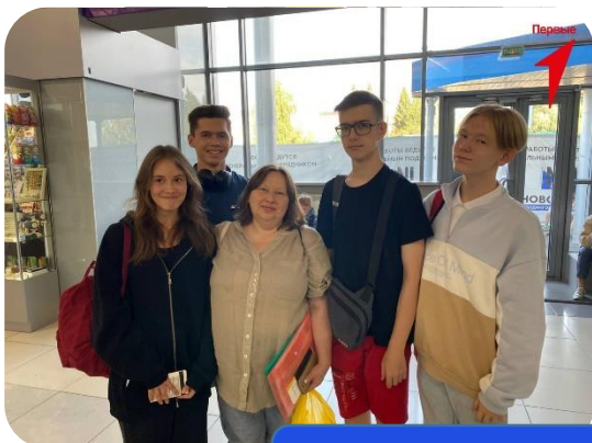
Хор Первых (Таврида)

Всего более 100 участников Финалов Федеральных мероприятий и событий. Движение дает возможность развиваться и узнавать свою страну лучше!