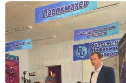
Выезд ОТКРЫТИЕ ПРОЕКТНЫХ ОФИСОВ В ЛНР И ДНР

Проект-конкурс направлен на развитие у обучающихся профессиональных образовательных организаций навыков публичных выступлений и вовлечение их в проектную деятельность Движения. Участники проходят 3-хдневное обучение и получают возможность стать региональными амбассадорами проектов Движения Первых, реализуемых первичными отделениями на базе учреждений системы профессионального образования