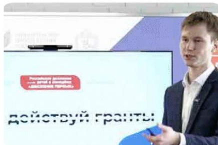
Онлайн-марафон ПРОСТО ДЕЙСТВУЙ